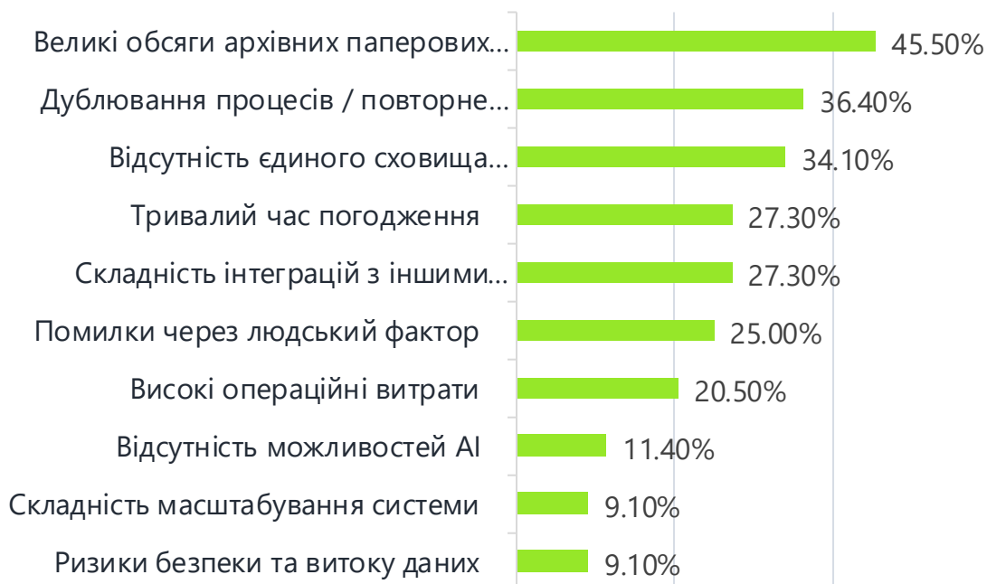
Виклики у поточному документообігу

Тривалий час погодження та складність інтеграцій з іншими системами не влаштовують 27% респондентів, а помилки через людський фактор згадував кожний четвертий.