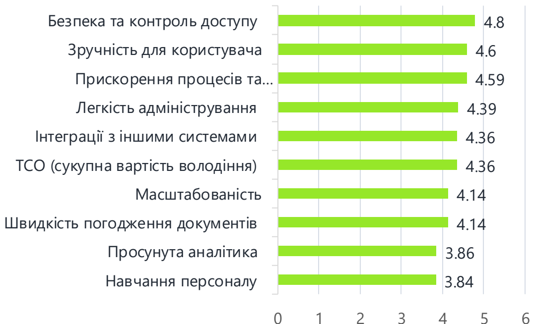
Ключові фактори під час вибору системи ЕДО